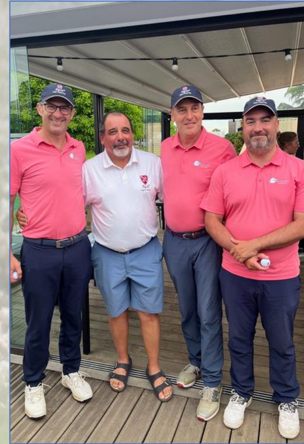
2-Équipe ASCLF Aviation Civile