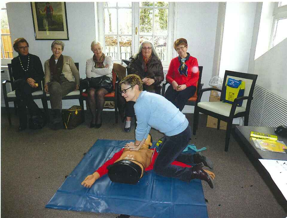
Formation à la réanimation au Golf Club de Strasbourg

Les parcours de golf accueillent pendant toute la saison un public varié et surtout composé de seniors dont la probabilité de se retrouver en arrêt cardiaque est plus importante. Avoir un DAE dans un club n'est pas aujourd'hui une obligation mais une recommandation. Il doit être clairement signalé par ce symbole et accessible rapidement en cas de nécessité. Il est préférable d'avoir un contrat de maintenance garantissant son bon fonctionnement.